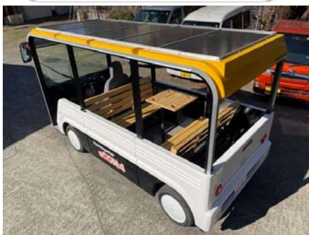
屋根の上にはソーラーパネルも