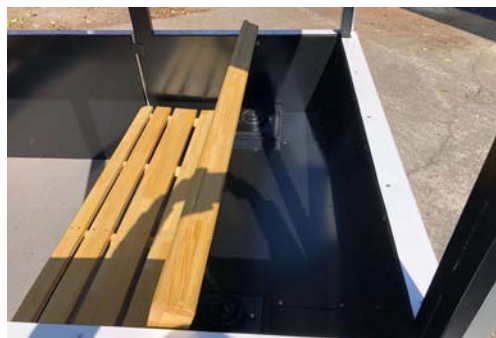
シート後部に大容量荷物スペース

サイドパネルおよび4本のピラーとピラーを結ぶクロスメンバーが側面衝突から乗客をしっかり守ります