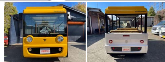
Thinktogether eCOM-4 主要諸元