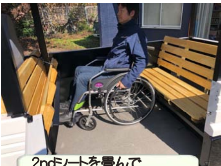
2ndシートを畳んで車椅子の方も乗車可能