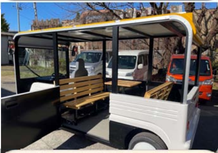
お年寄りにも乗降りしやすい低い床

軽自動車より一回り大きいだけの超コンパクトサイズ。乗客6人を乗せてどこにでも入って行けます